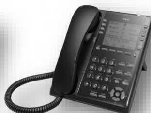
โทรศัพท์ IP รุ่น 8 ปุ่ม