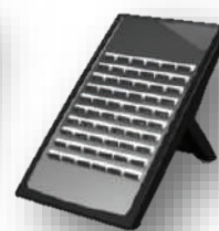
DSS คอนโซล 60 ปุ่ม