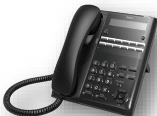
โทรศัพท์ดิจิทัลรุ่น 12 ปุ่ม